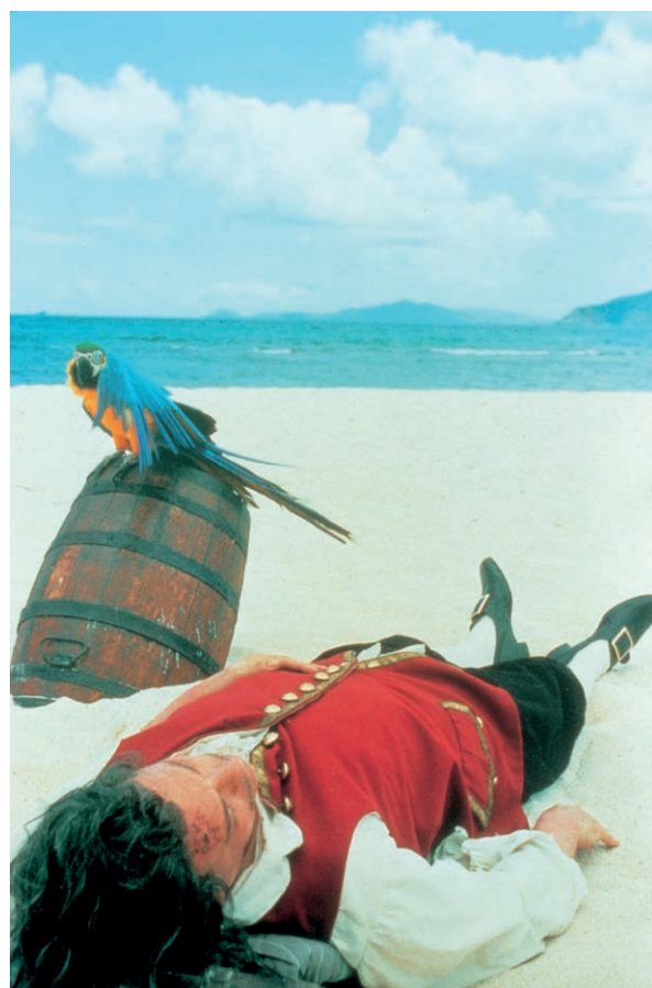
Rodney Graham Vexation Island , 1997 FNAC 980836 Centre national des arts plastiques © Rodney Graham / Cnap / Crédit photo: courtesy Lisson Gallery