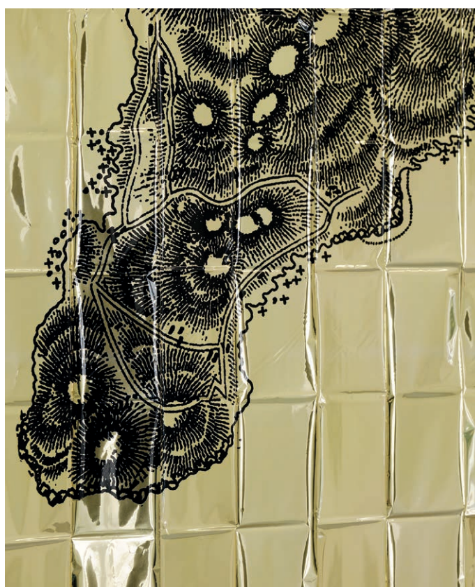
Benoît Billotte Isulae (détail), 2015 5 sérigraphies sur couverture de survie, 160 x 210 cm Courtesy de l'artiste - production centre d'art contemporain La Villa du Parc, Annemasse