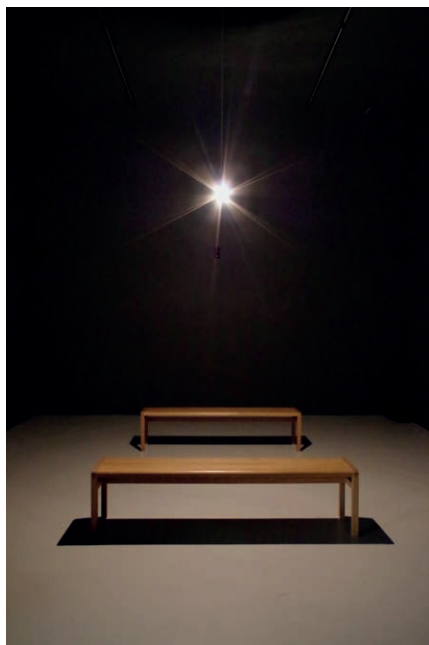
Philippe Lepage C'EST DU VENT , 2015 Installation sonore pour 5 haut-parleurs, 2 bancs en vis-à-vis et une ampoule électrique, dimension variable Courtesy de l'artiste Crédit photo : Marynet Jeannerod

Saint-John Perse, «La Ville», Images à Crusocé.