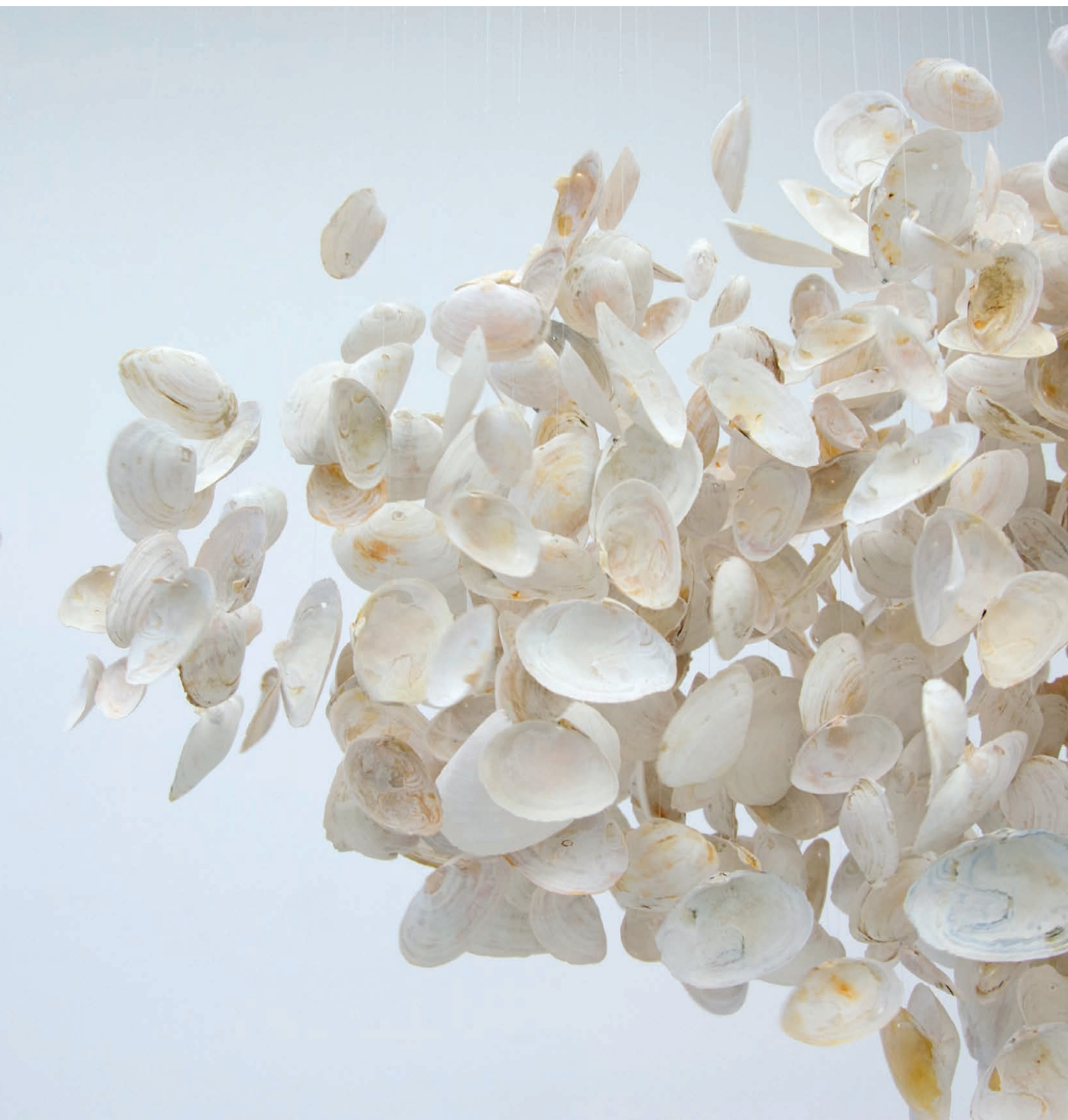
Stéphane Clor Imaginary Soundscape (détail), 2016 Installation sonore, techniques mixtes, moteurs, haut-parleurs, programmation, field recordings