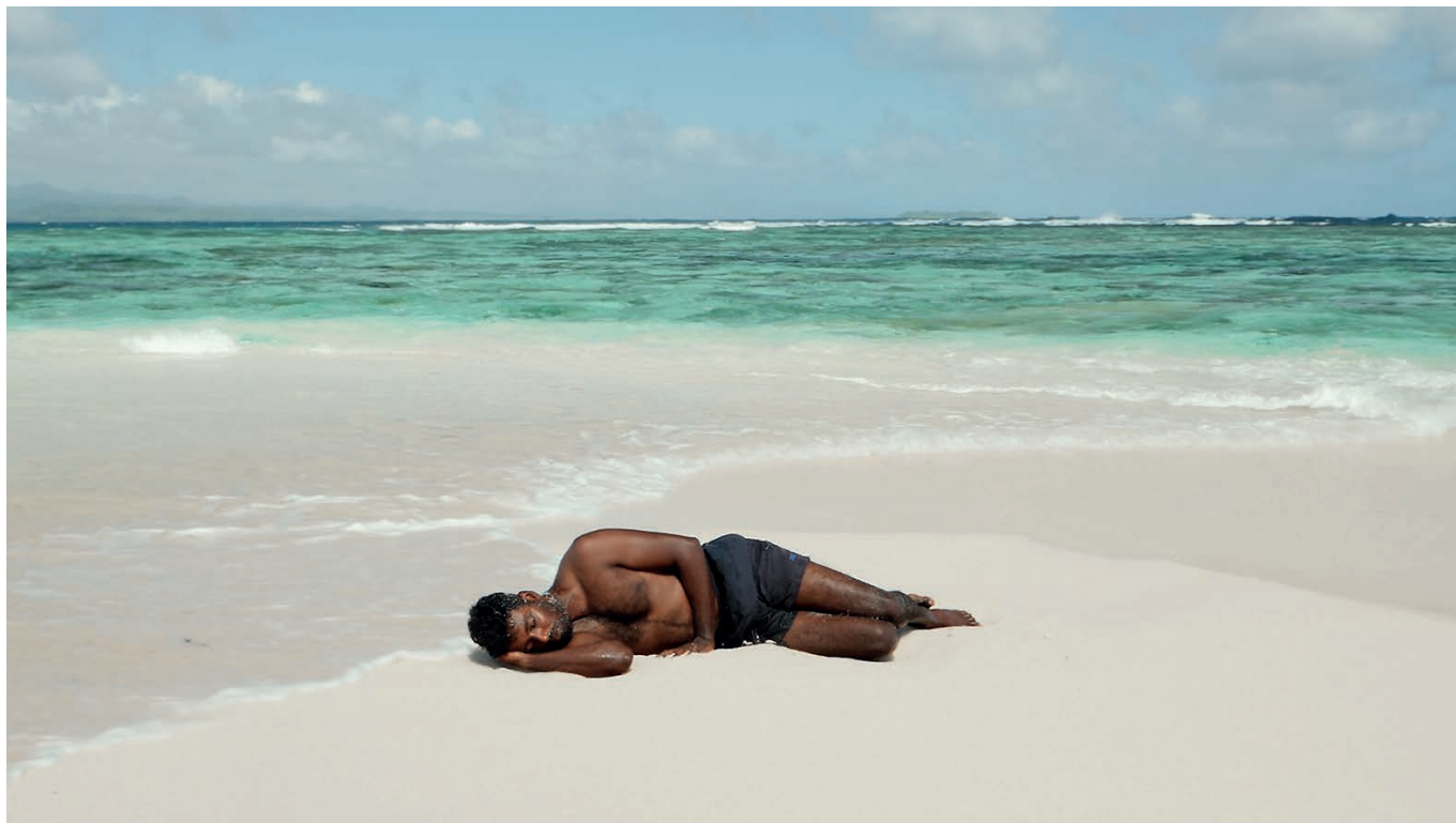
Hoda Afshar Remain , 2018 Vidéo numérique à deux canaux, couleur, son, 23 min.29 Courtesy de l'artiste et de Milani Gallery © Hoda Afshar, Milani Gallery.