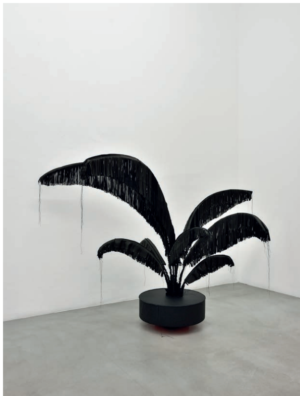
Sébastien Gouju Fougère , 2019 Cuir, bois peint et acier, 102 × 157 Ø 41 cm. N° Inv. SG19004