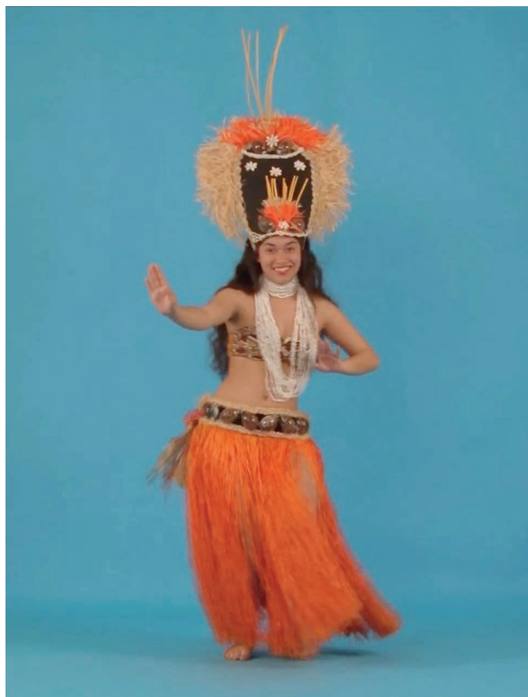
Charles Fréger, Blue Heaven , 2012, Installation vidéo, 6 vidéos.