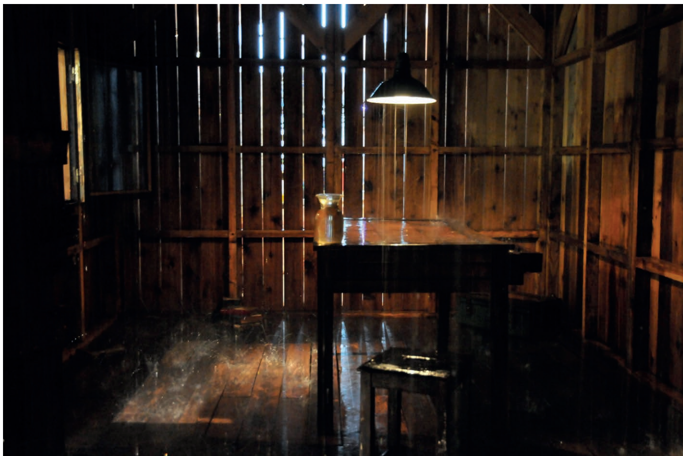
Stéphane Thidet Sans titre ( Le Refuge ), 2007 Collection les Abattoirs Musée - Frac Occitanie Toulouse © Adagp, Paris, 2022

« Pas un buisson, pas un arbuste pour se mettre à l'abri ; et là-haut on nous brasse encore une tempête. Je l'entends chanter dans le vent. Là-bas ce nuage noir, oui, ce gros-là, me fait l'effet d'une sale barrique prête à jeter son liquide. S'il doit tonner comme tout à l'heure, je ne sais pas où je pourrais cacher ma tête. Il ne peut pas manquer, ce nuage-là, de tomber à pleins seaux. - Qu'est-ce que ça é Un homme ou un poisson é Mort ou vivant é (...) Ce n'est pas un poisson, c'est un insulaire que la foudre aura tué. (Bruit de tonnerre.) Hélas ! Voici l'orage encore ! Ce que j'ai de mieux à faire est de me glisser sous son caban; il n'y a pas d'autre abri aux environs. Le malheur vous donne de bizarres compagnons de lit. Je vais m'abriter là jusqu'à ce que la tempête est jeté sa lie »