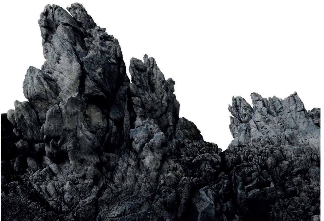
Cécile Beau Isle , 2014, Impression contrecollé sur dibond Série de sept photographies, 60 x 45 cm