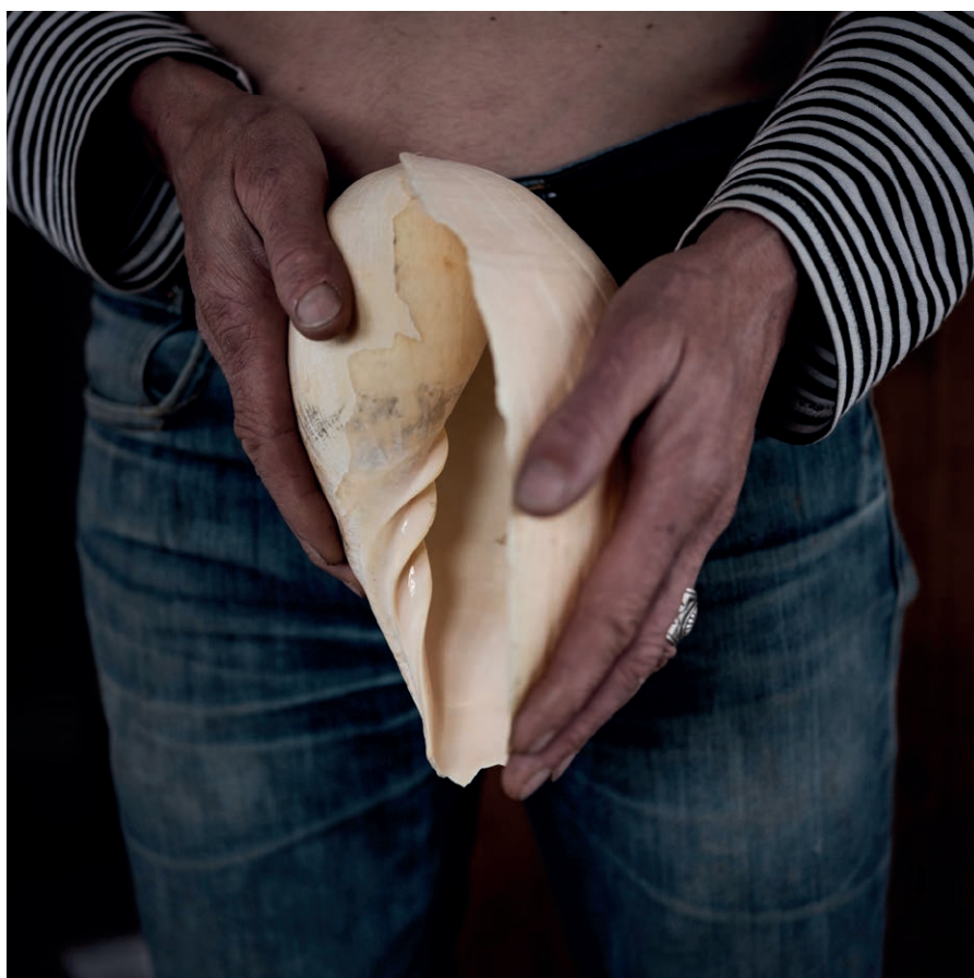
Yohanne Lamoulère L'île (extrait), 2020 Série de photographies.