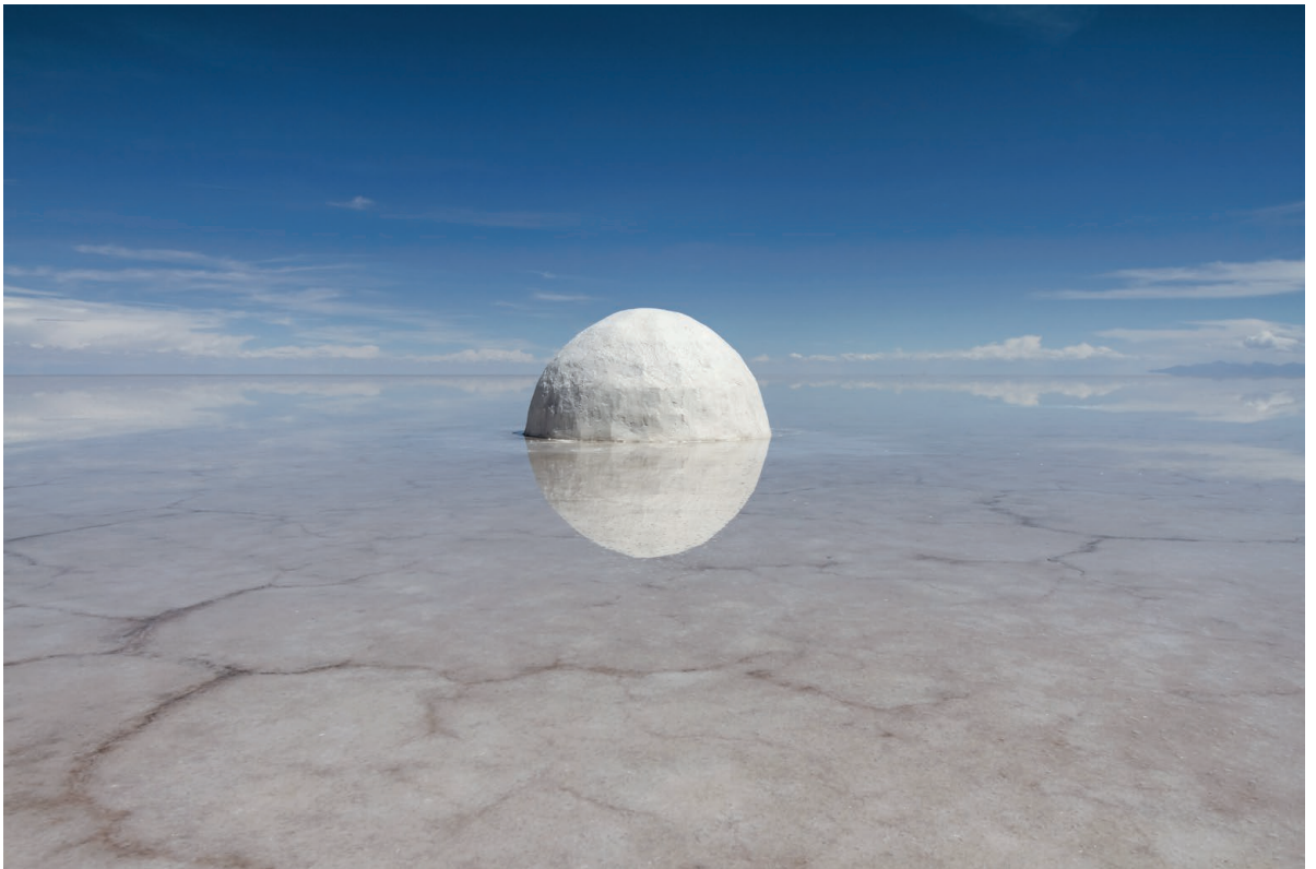
Guillaume Barth, Elina , 2015

Photographie de la sculpture en sel et eau, 300cm de diamètre, Salar de Uyuni, Bolivie, projet-Elina, 2013-2015.