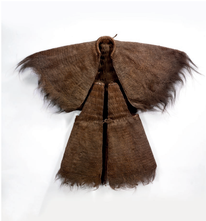
Cape de pluie, Philippines, fin du 19 e siècle Tissu infrapétiole de palmier- aréquier surpiqué