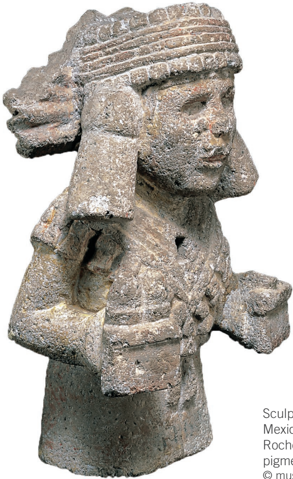
Sculpture anthropomorphe de déesse, Mexique, culture Aztèque, 1350-1521 Roche volcanique dense de couleur grisâtre; pigments ocre de goethite et rouge d'hématite