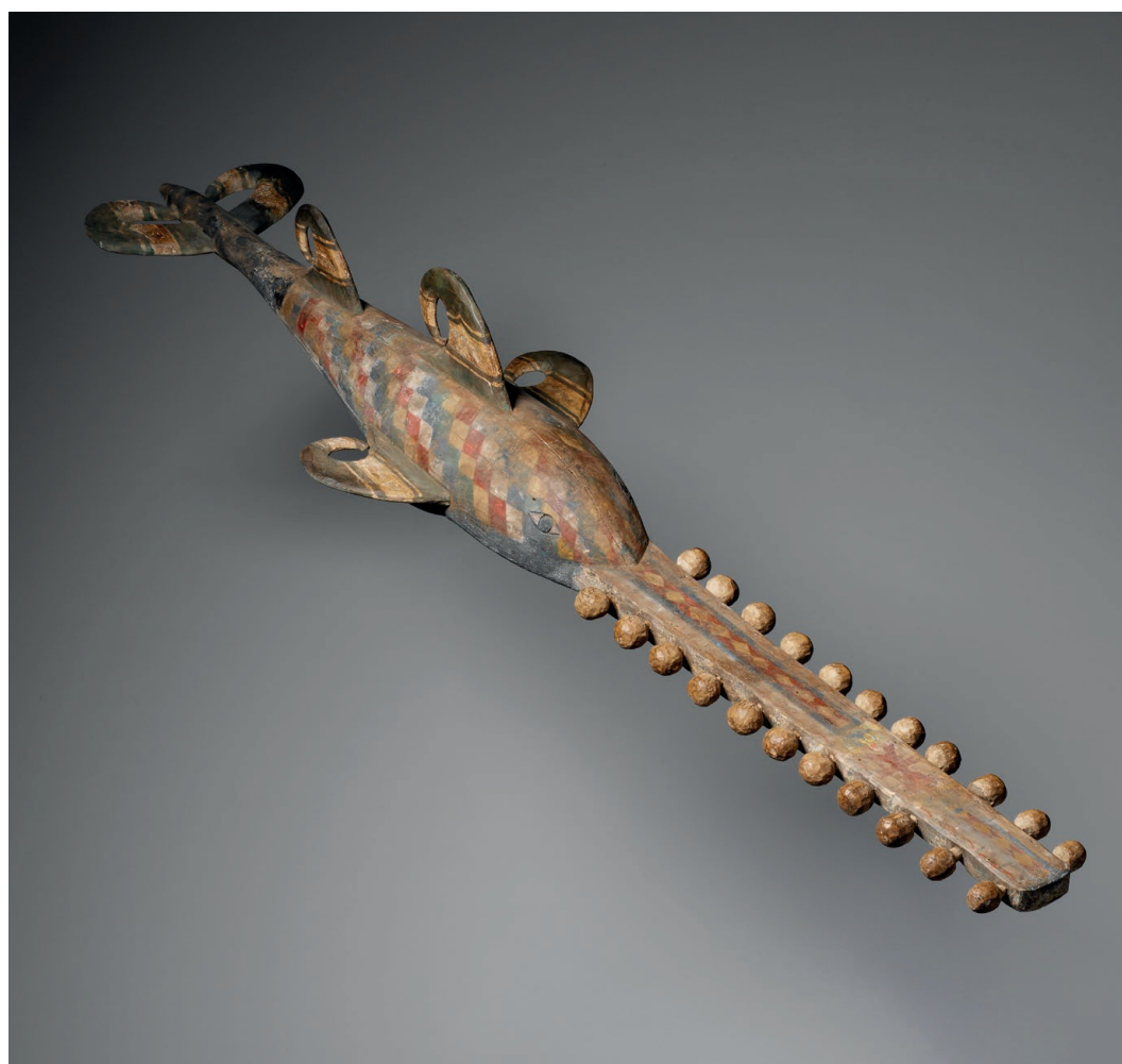
Masque-cimier poisson-scie, Nigeria, population Ijo, 20 e siècle Bois, pigments dont kaolin et ocre