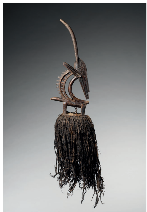
Masque cimier, Ciwara , Mali Population Bamana, avant 1931 Bois et fibres végétales teintes à la boue