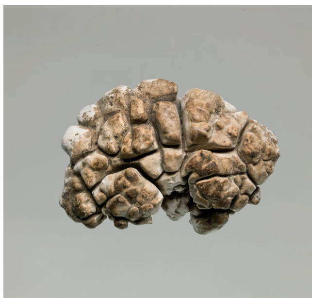
Pierre à magie, Nouvelle-Calédonie, population Kanak Milieu 19e - début 20e siècle Lithique, concrétion de magnésie