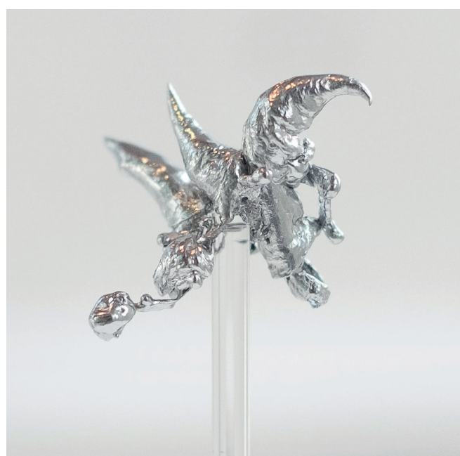
Benoît Pype, Chutes libres , 2015 Installation, étain, 2 x 2 x 1 cm