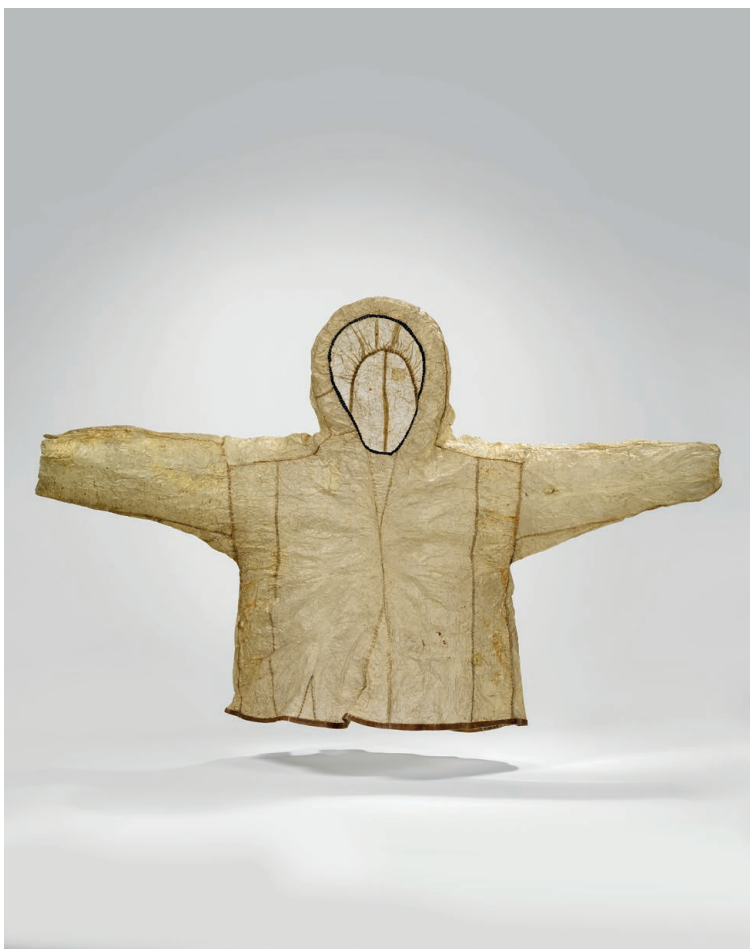
Anorak d'enfant, Alaska, Amérique Culture Yupik/Inuit, fin du 19 e siècle Intestin de phoque, cuir