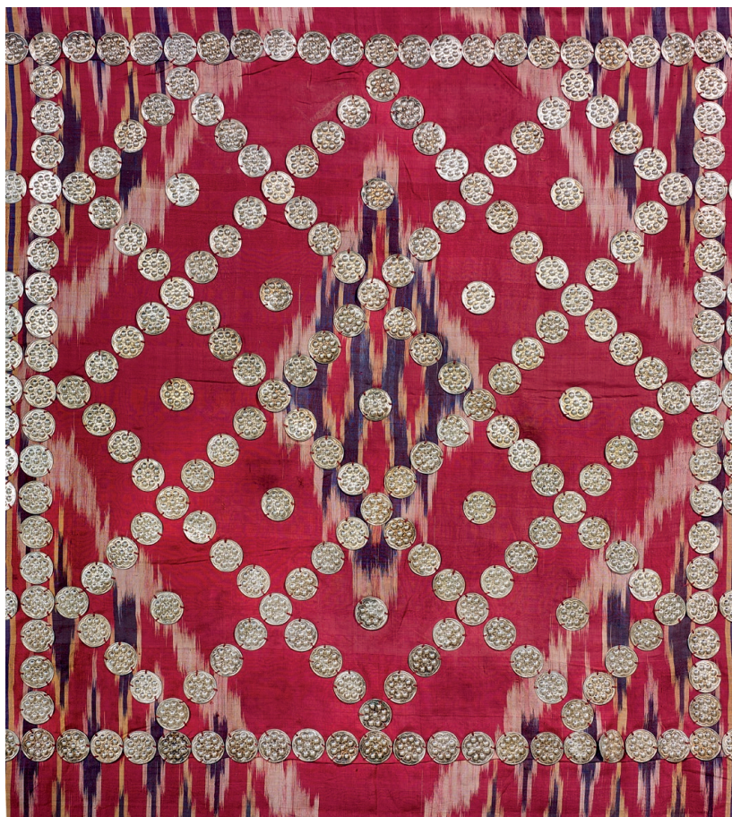
Drape de bain, Bagdad, Iraq Début du 20 e siècle Soie ikatée, argent