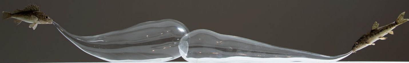
Olivier Leroi, Souffles , 2007 Poissons taxidermisés, verre soufflé, 12x100 x8 cm