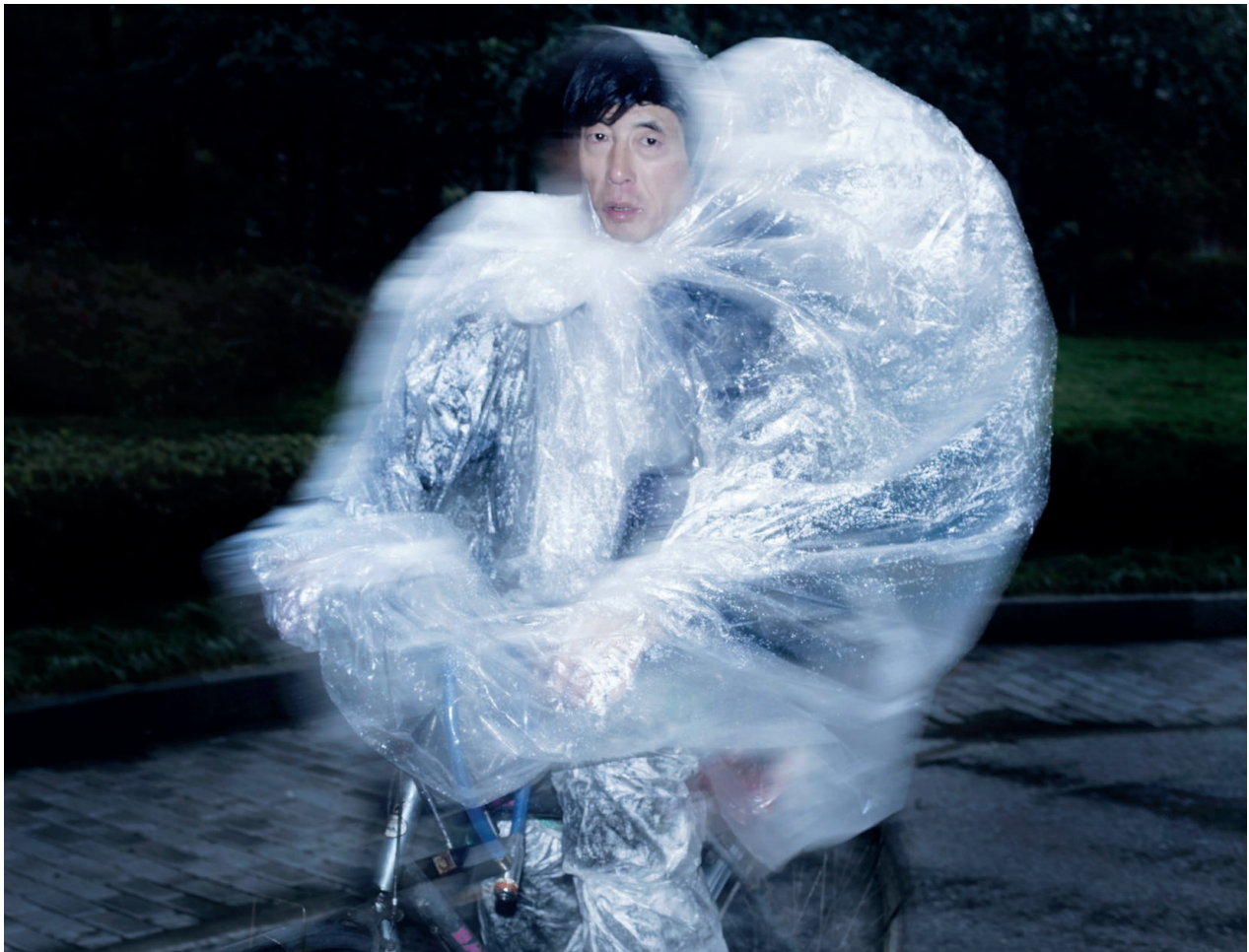
Wiktoria Wojciechowska, Short Flashes (détail), 2013 Photographie, 80 x 768 cm